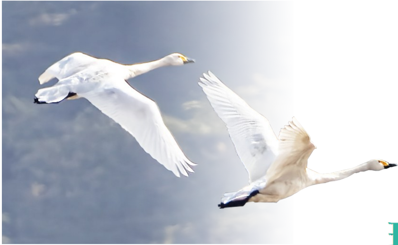
天鹅 国家二级保护动物（摄于白泉）