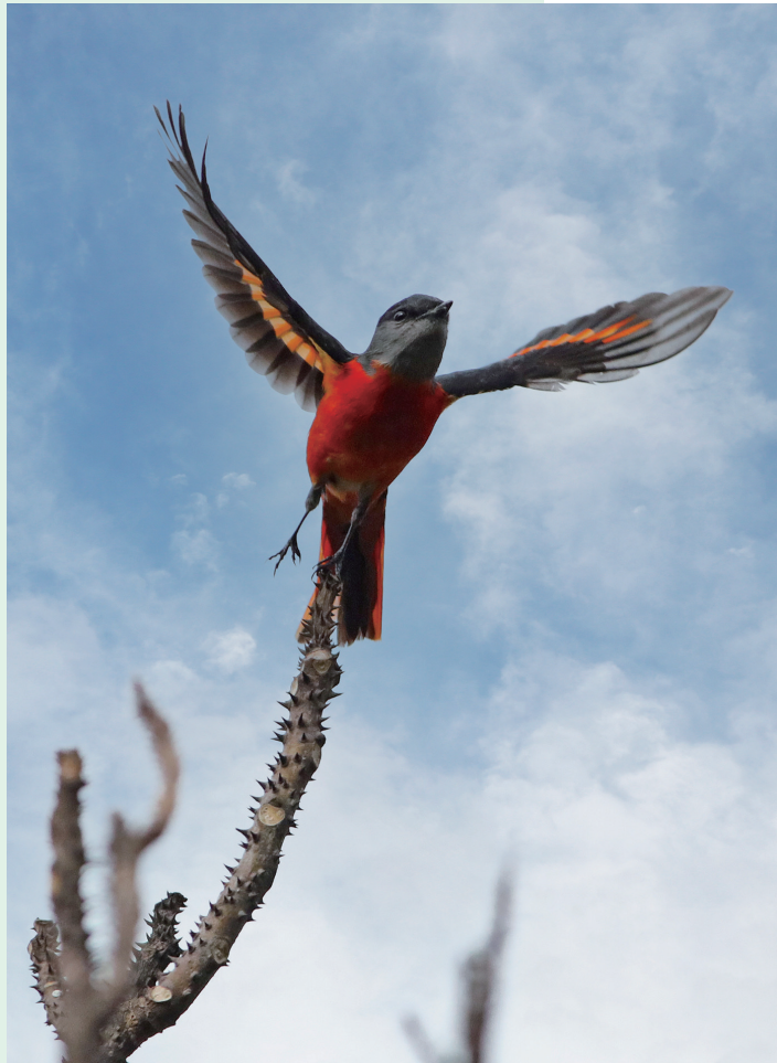
灰喉山椒鸟（摄于双桥）