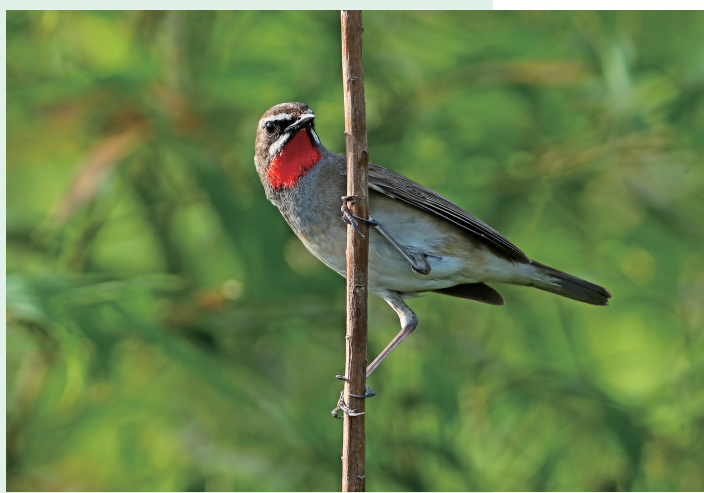
红喉歌鸲 国家二级保护动物（摄于盐仓）