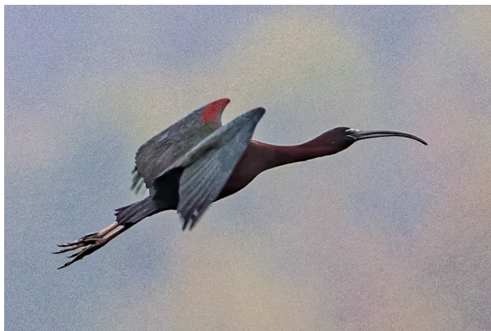
彩鹮 国家一级保护动物（摄于白泉）