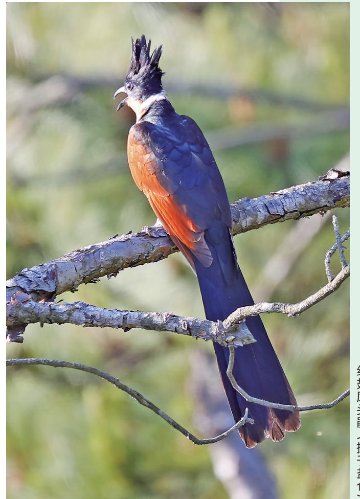
红翅凤头鹀（摄于盐仓）