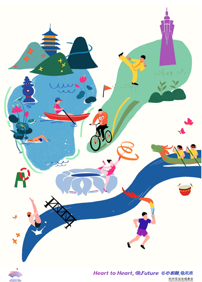
Heart to Heart, @Future 心心相融, @未来 杭州亚运会组委会