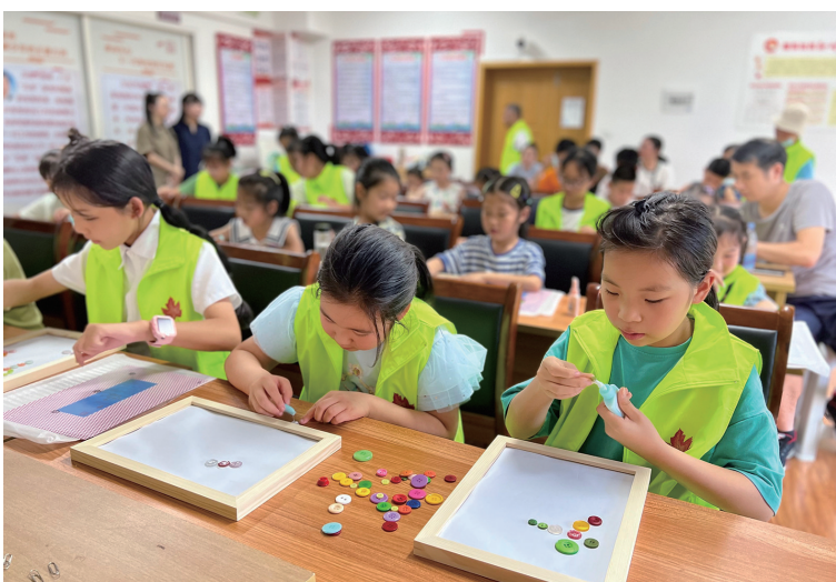
城东街道檀东社区近日邀请麦乐社工举行“迎亚运 纽扣海报”主题活动,让孩子们增强体育意识和团队合作精神,感受亚运氛围。

龄段的参赛队伍都有,这也充分体现了‘唱响定海’这一群众文化活动品牌多年打造成果。”区文化馆团队发展部部长张颖颖说,今年是举办“唱响定海”大型文化活动的第15年,我区将持续深化这一全民艺术普及的重要平台,突出群众主体地位,凸显“本土性、草根性、全民性、互动性”特色,以主题化的全民文体活动为载体,在满足人民群众对美好生活的新期待和新需求上发挥积极作用。