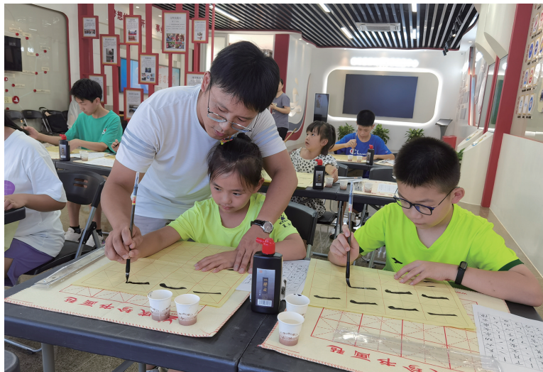
“沁润传书香 翰墨迎亚运”少儿书法培训公益课堂近日在定海区新时代文明实践中心开课,弘扬中国传统书法艺术,喜迎亚运会的到来。