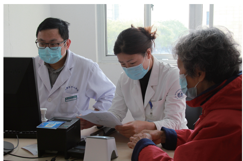
日前，浙江省人民医院定海分院开展“关爱女性健康”义诊活动。活动现场，来自浙江省人民医院乳腺外科等学科专家坐诊，耐心为市民答疑解惑。

论。会上还进行了“传承党的工作保密优良传统 做好新形势下保密工作”主题党课。下一步，该中心将持续开展主题党日活动和党课宣讲等形式多样的主题教育活动，牢固树立党员干部爱岗敬业、政治廉政的工作作风，引导青年党员干部树立创先争优意识，坚守清正廉洁的底线，厚植为民情怀，涵养崇尚廉洁品格。