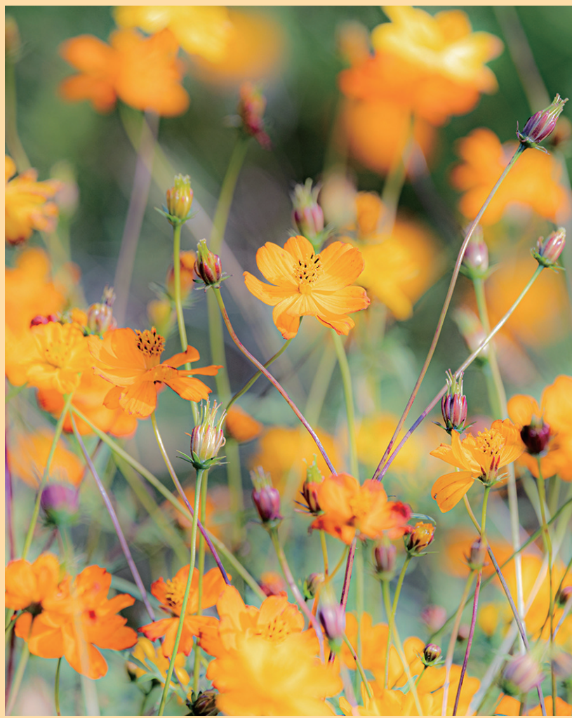
花儿奋力舒展身姿