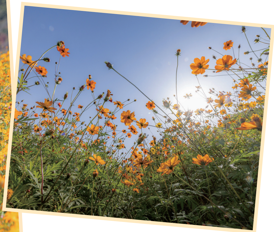
花海无垠 日光染香