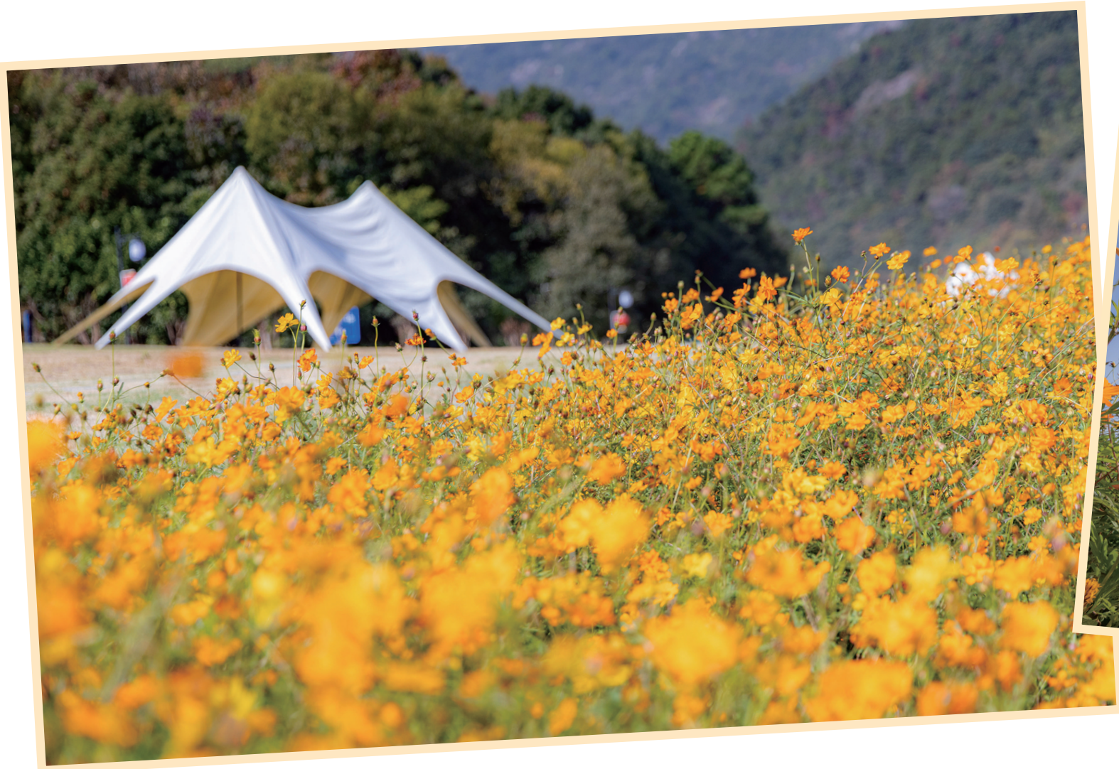
风摇花影 香沁心脾