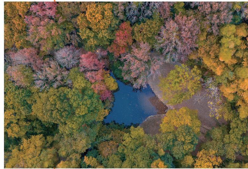
东海百里文廊盐仓段