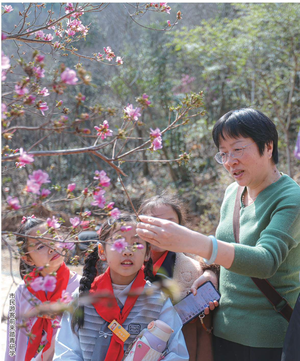
市民游客前来踏青研学