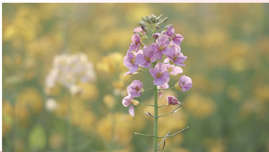
东海百里文廊白泉段彩色油菜花田迎来盛花期