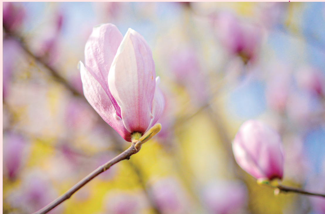
枝头的玉兰花亭亭玉立