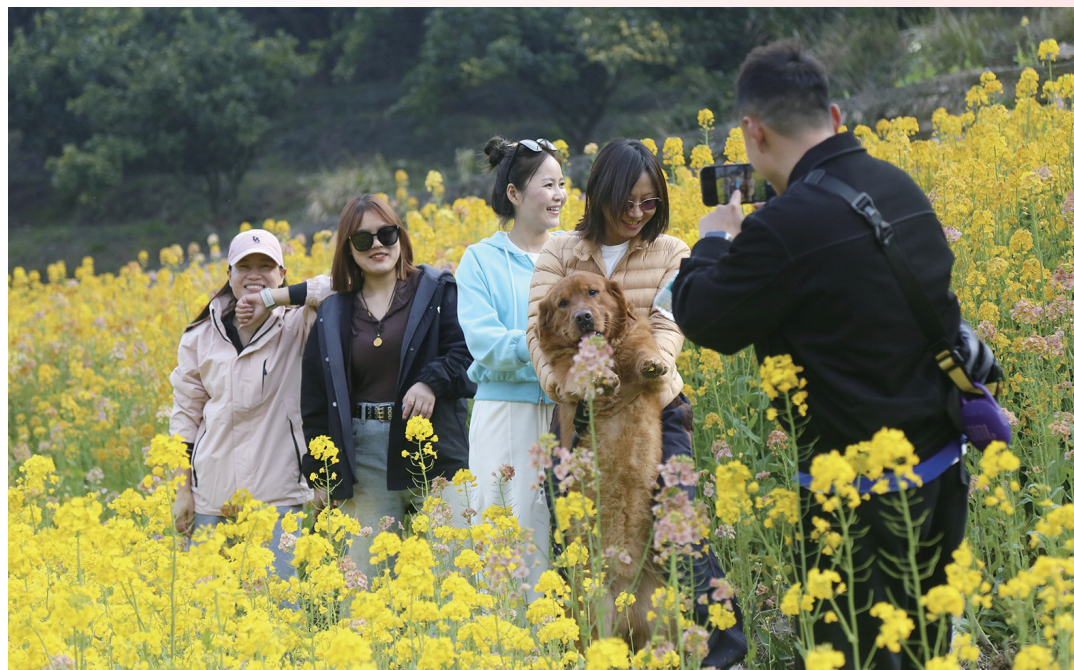
市民游客前来漫步赏景