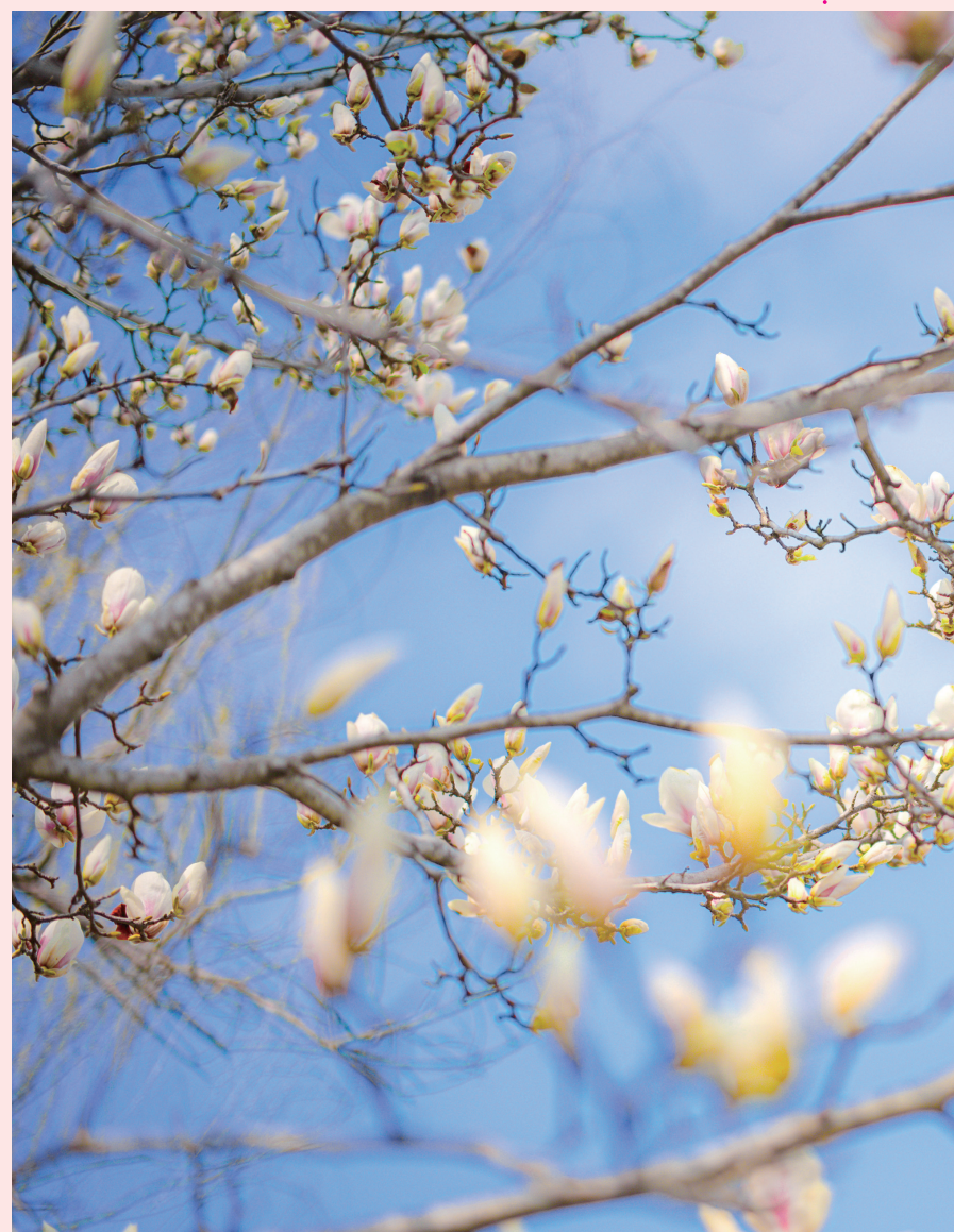
城区街巷间的玉兰次第盛开