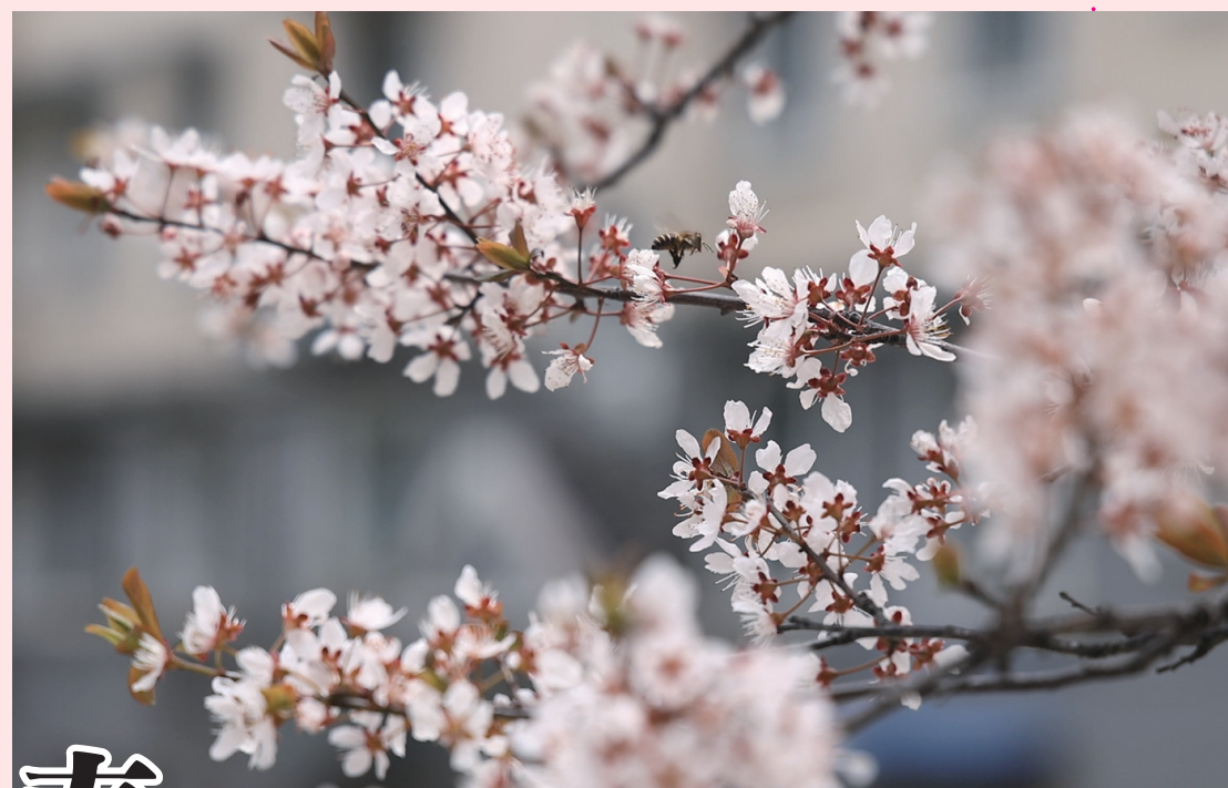
满树的紫叶李迎着春风暗香浮动

不负春光，不负花期。连日来，定海春意渐浓，各色花卉争相绽放。微风拂过，花香四溢，让人忍不住放慢脚步，沉醉在这无边的春色里。