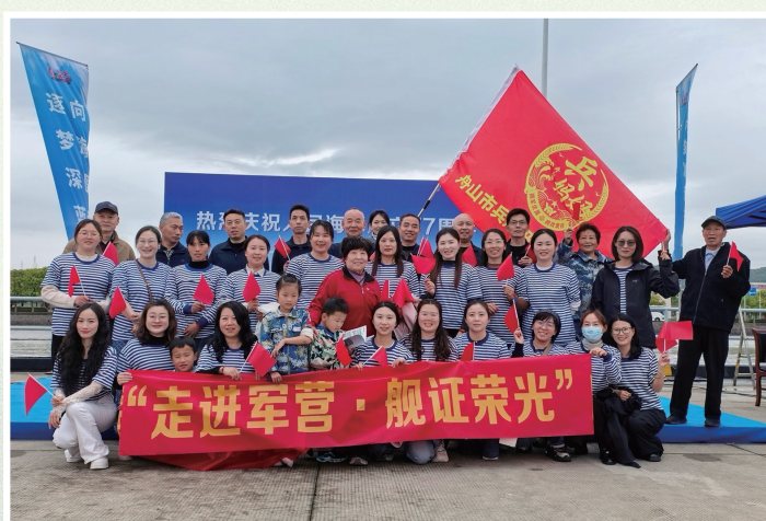
退役军人和军嫂军娃代表参观军舰

77载劈波斩浪，人民海军从近岸走向深蓝；77年薪火相传，一代代海军官兵和他们的家人，用忠诚与奉献托举起大国海军的钢铁脊梁。“军民同心庆华诞·深蓝薪火代代传。”这不仅是活动的主题，更是舟山这座千岛之城的庄严承诺。深蓝征途仍在继续，薪火相传的故事还将在这片热土上，一代又一代续写下去。