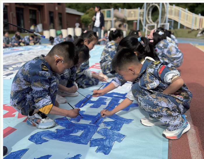
“海娃”共绘数十米“深蓝长卷”

东海之滨，千岛之城，春风送暖，鱼水情深。在人民海军成立77周年之际，由舟山市退役军人事务局、定海区退役军人事务局主办，舟山市兵妈妈工作室承办的“军民同心庆华诞·深蓝薪火代代传”系列主题活动温情启幕。从童真画笔勾勒深蓝梦想，到老兵相聚共忆峥嵘岁月，再到走进军营触摸钢铁脊梁，串起的是薪火相传的精神血脉，凝聚起全社会尊崇军人、关爱军属的深情厚谊。