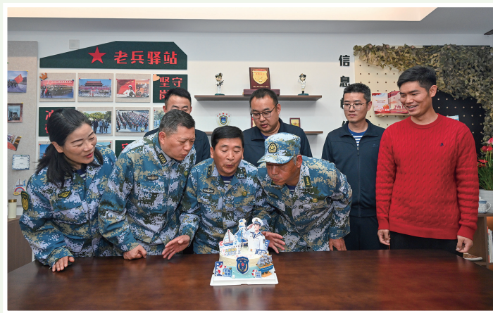
退役老兵共话初心使命传承