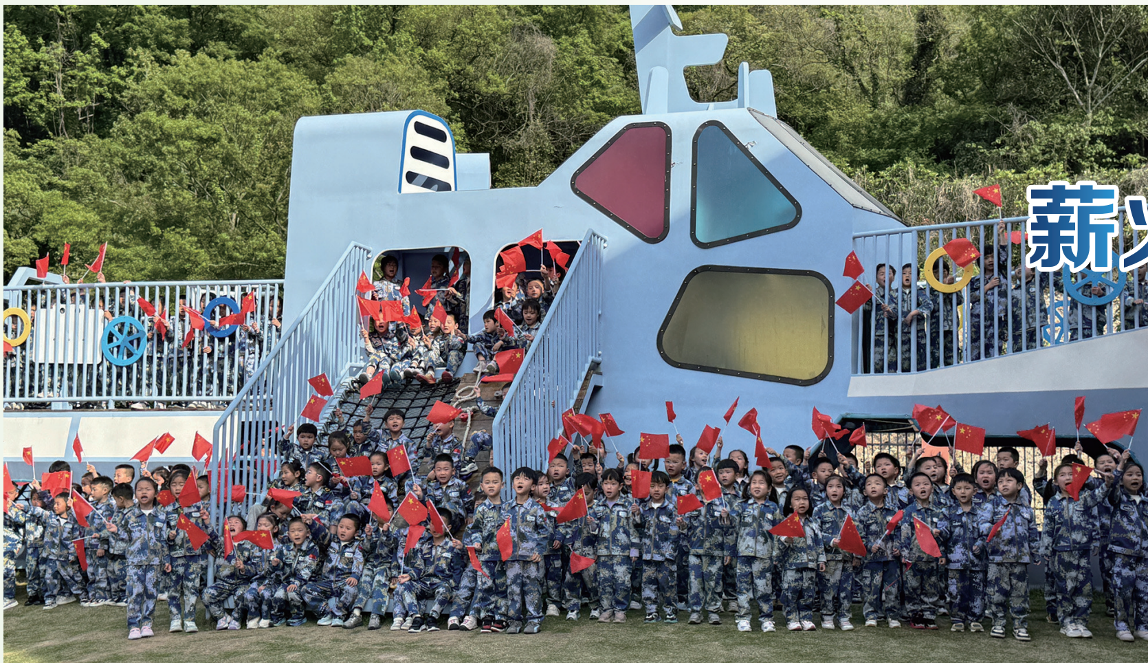
“海娃”们齐唱《人民海军向前进》